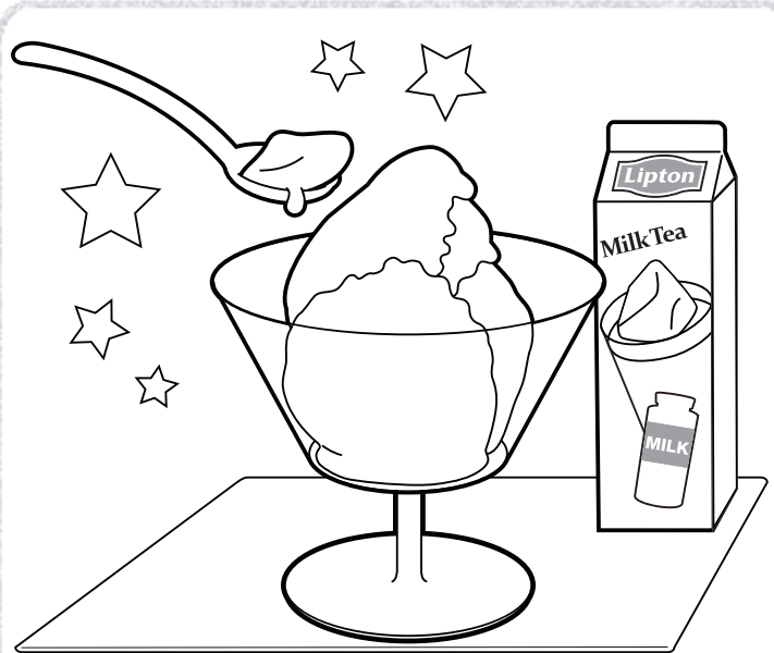
「ひんやりかんたん」フローズンミルクティー