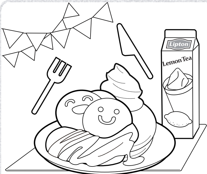
レモンティーシロップ&クリームホットケーキ